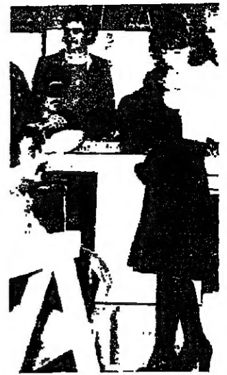
طالبة ساعد للالتحاق

ففي الاحتفال الذي جرى في معهد الفنون مساء أمس الأول، والذي حضره «الأخبار» عن نشر بعض